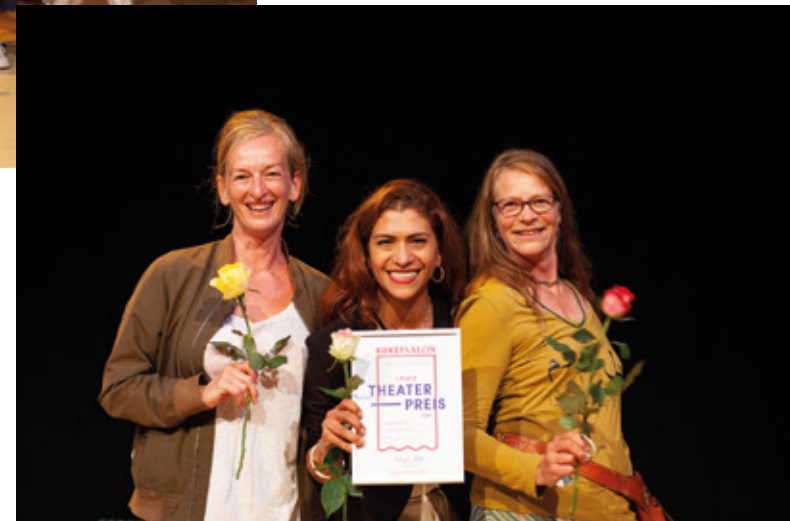
Wehr51 kamen mit ihrem Tanzstück FRACTURA auf den ersten Platz, Foto: Adam Kroll

Den KunstSalon-Theaterpreis gibt es seit mittlerweile fünf Jahren in Folge: Lückenlos fortgeführt werden konnte er allen Umständen der letzten Zeit zum Trotz dank kontinuierlicher privater – großzügiger – Förderungen.