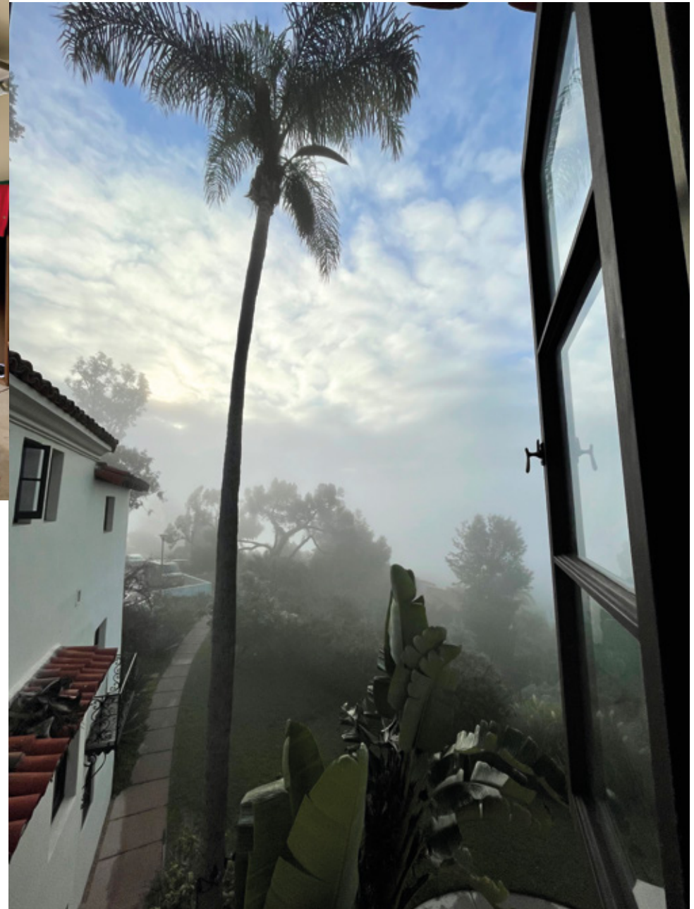
Schöne Aussichten: Blick aus dem Fenster der Villa Aurora.