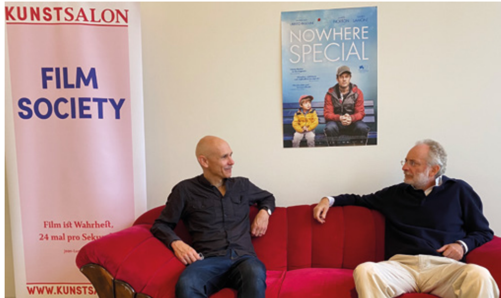
Regisseur Uberto Pasolini kam im Oktober für die »Nowhere Special«-Preview extra aus seiner Wahlheimat England angereist.

mit den überwältigenden Breitwandformaten, die ein Fernseher so gar nicht ins heimische Wohnzimmer transportieren konnte. Und die Multiplexe der frühen 90er-Jahre konnten dem Abwärtstrend der vorherigen Jahrzehnte mit Komfort und bestem Ton und Klang etwas entgegensetzen und zudem mit einem neuen Erlebnisparkours rund ums Kino, der einer Shoppingmall gleich.