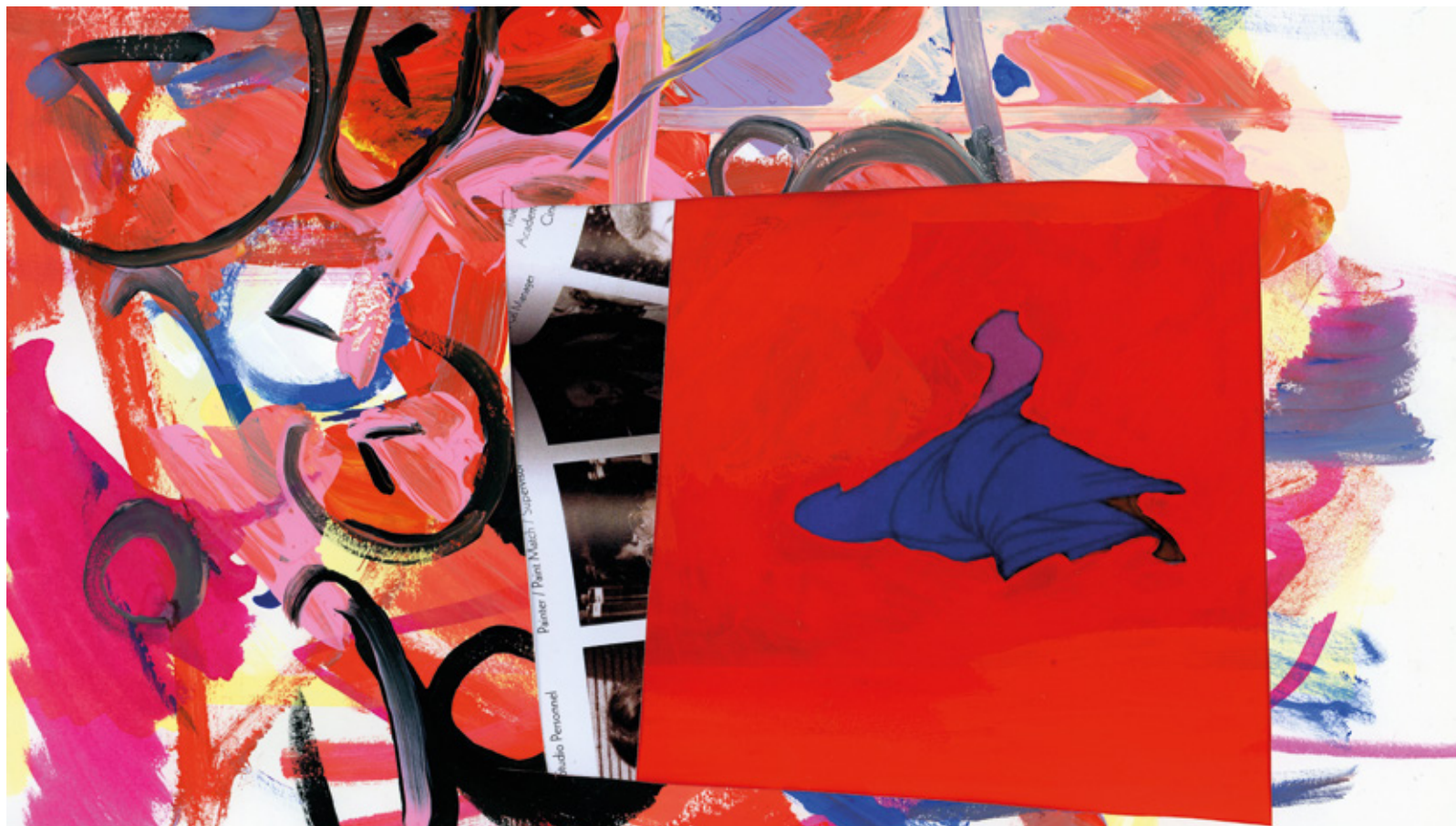
Sarah Szczesny, »The Stretch (Aurora)« 2021, Video Still