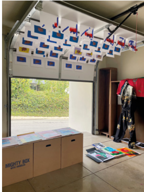
Atelier-Garage in der Villa Aurora mit Werken von Sarah Szczesny. Foto: Sarah Szczesny

Zum Stipendium gehören eine Publikation und eine Ausstellung, die voraussichtlich 2022 in der Fuhrwerkswaage zu sehen sein wird.