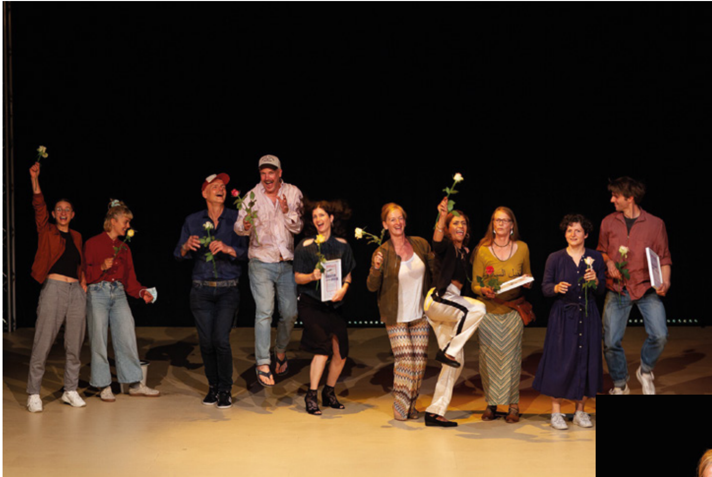
Die glücklichen Gewinner*innen 2021: Analogtheater holten mit »Geister ungesehen. Ein deutsches Trauma« den zweiten Platz. Drittplatzierte und Gewinner*innen des Publikumspreises für »Umzug in eine vergleichbare Lage« sind Artmann&Duvoisin