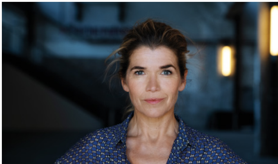
Anke Engelke war im Januar 2021 der erste Gast unserer Zoom-Veranstaltungen

und hatte mit der Digitalisierung ab der Jahrtausendwende eine zweite Chance. Doch auch die erste Euphorie dieses zweiten Versuchs, die neue Technik durchzusetzen, hat sich längst wieder gelegt. Die Digitalisierung im Allgemeinen, die Mitte der 1990er-Jahre sowohl mit ersten komplett computeranimierten Filmen wie auch gänzlich digital gedrehten Spielfilmen startete und inzwischen bis hin zum Abspiel im Kino als vollzogen gilt, hat einige Umwälzungen gebracht. Im Guten wie im Schlechten ästhetische Neuerungen, aber auch ökonomische und logistische. Letztere erleichtern auch der filmsociety die Programmierung ihrer Previews. Eine Sondervorführung ohne 35mm-Filmrollen ist schlicht leichter zu planen, als das noch vor 20 Jahren der Fall war.