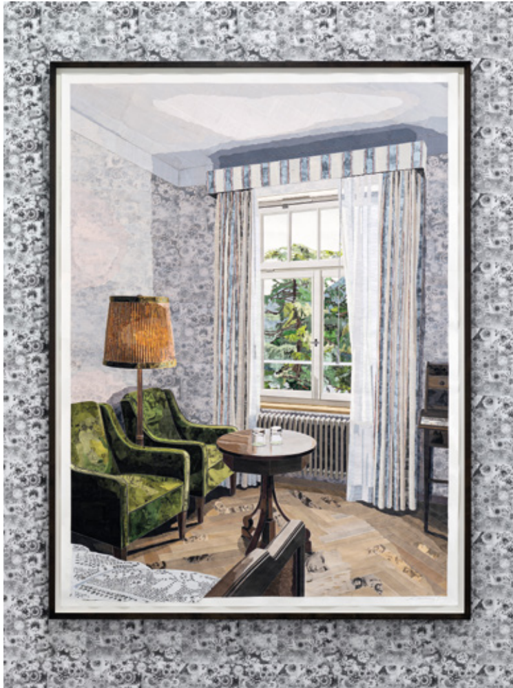
Marcel Odenbach, zur Ruhe kommen, 2021, Collage, Fotokopien, Bleistift und Tinte auf Papier, 222 x 165 cm, Galerie Gisela Capitant, Köln, Kunstsammlung Nordrhein-Westfalen 2021, © VG Bild-Kunst, Bonn 2021

Bildmaterial besteht, das weitere Bedeutungsebenen eröffnet. Daneben verwendet Odenbach auch Auszüge aus Textdokumenten, Gedichten, Briefen, Zeitungen. Während das Motiv aus der Ferne beispielsweise eine scheinbare Idylle vorgaukelt, offenbaren sich aus der Nähe eindeutige Verweise auf die dunklen Flecken der Geschichte, werden politischer Kontext hergestellt und unweiger-